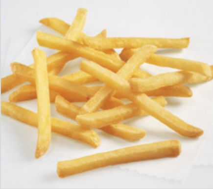
1/4 Corte Delgado (X11)