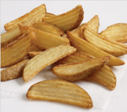
Crinkle Wedge Cut (X30)