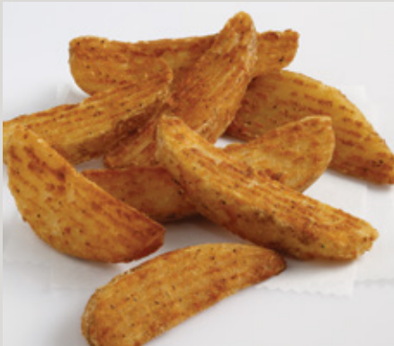
Chicken Batter Recipe Slim Crinkle Deli Wedge® Cut (X24)