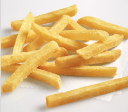
3/8 Corte Regular (X13) También disponible: 5/16 Corte Regular Delgado (X12)