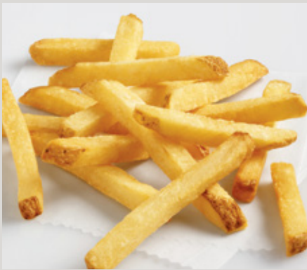
3/8 Corte Regular (X23) Con Cáscara