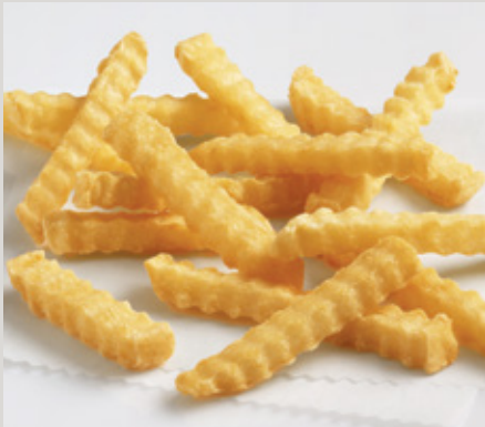
5/16 Slim Crinkle Cut (X16)