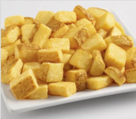
Breakfast Cubes (X01)