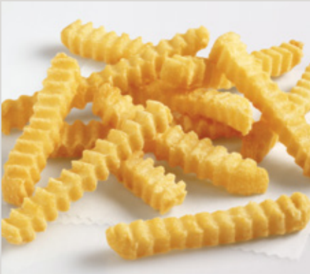
1/2 Concertinas® (X14)