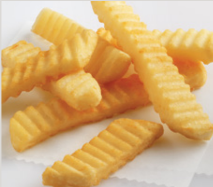
Colossal Crinkle® (X15)