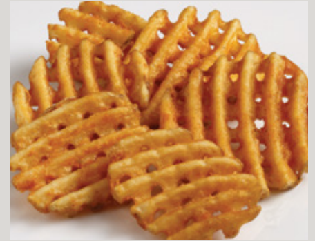
Lamb's Seasoned® Receta Original® Papas CrissCut® (D23)

También Disponible: Receta Picante (Y0066) Receta Tempura (25D) aMAIZEing Fries® (P26)