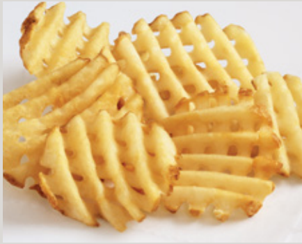
Papas CrissCut® (P55) Con Cáscara

También Disponible: Receta Picante (34Z) Western Spicy Crispy QQQ's® (24322)