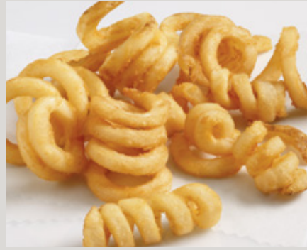
Tater Boy® Crispy QQQ's® (24328)

También Disponible: LW Private Reserve® (G0033)