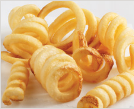
Papas Twister® (C0077) Con Cáscara

También Disponible: LW Private Reserve® (G0033)