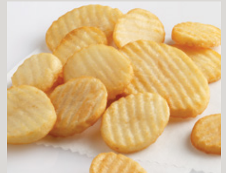
Rusettes® Cottage Fries (02124)

También Disponible: Generation 7 Fries® Bites (D20) Colossal Crinkle® (X15) Tater Boy® RibCut® (24253)