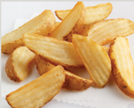
LW Private Reserve® Crinkle Wedge Cut (33D)

También Disponible: Generation 7 Fries® (X30)