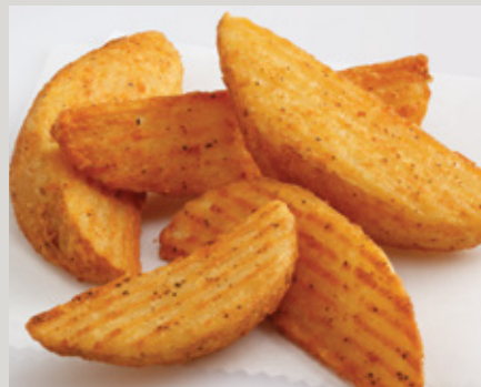
Lamb's Seasoned® Chicken Batter Recipe Crinkle Deli Wedge® (D17)

También Disponible: Generation 7 Fries® (X30)