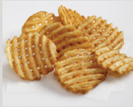
Lamb's Seasoned® Southern Style Recipe Mini CrissCut® Fries (K0120)

También Disponible: Stealth® Con Cáscara (S15) LW Private Reserve® (33L) Yukon Selects® (Y1005) Sweet Things® (L0090)