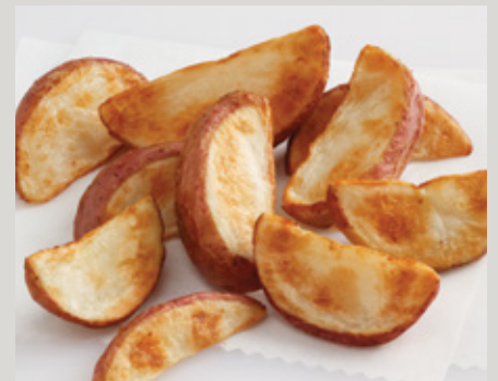
Alexia® Oven Roasted Red Skin Wedge Cut (AX584) Sin Condimentos (AX586)

También Disponible: Slim (D19) Bites (D20) Generation 7 Fries® Slim (X24)