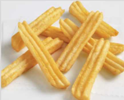
Lamb's Supreme® WaveLength Fries® (D07)

También Disponible: Receta Picante (Y0066) Receta Tempura (25D) aMAIZEing Fries® (P26)