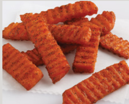
Sweet Things® Seasoned RibCut® Fries (L0097)

También Disponible: Sweet Things® Savory WaveLength Fries® (L0082)