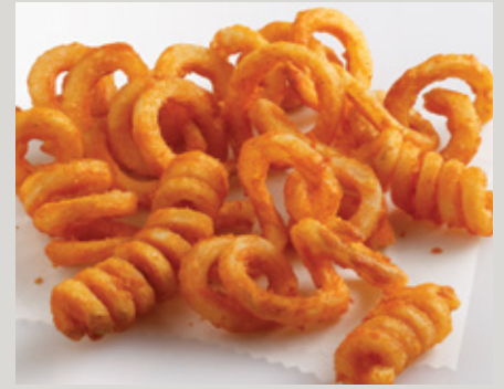
Lamb's Seasoned® Receta Original® Papas Twister® (D0073)

También Disponible: Curley QQQ's® (Q0004) Stealth® (S0010)